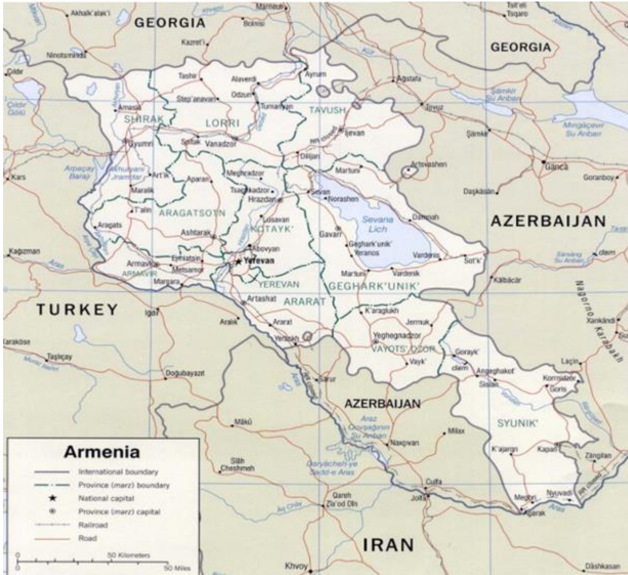
Պժայատկեր 3. Հայաստանի աշխարհագրական սահմանների քարտեզ