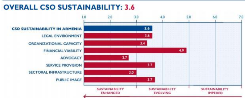
Գծապատկեր 2. Հայաստանի ՔՀԿ կայունության

Քաղաքացիական հասարակության և լրատվամիջոցների արդյունավետության չափման գնահատականը նույնպես շատ բարձր է (տե՛ս աջ կողմի նկարը): 13 Չնայած Հայաստանի քաղաքացիական հասարակության ու անկախ լրատվամիջոցների ոլորտներում զարգացման առաջընթաց է գրանցվել, մասնավորապես քաղաքացիական հասարակության շահերի պաշտպանության և հետաքննող լրագրության ոլորտներում (մասամբ ԱՄՆ ՄՁԳ-ի կայուն օգնության միջոցով), այդ ոլորտները դեռևս ունեն սուր կարիքներ, մասնավորապես՝ ֆինանսական կայունության / կենսունակության, լրատվամիջոցների սեփականության և մասնագիտական բարեվարքության առումով: Անհրաժեշտ կլինի պահպանել և հետագայում բարելավել քաղաքացիական հասարակության և ՋԼՄ-ների համար նպաստավոր միջավայրի ձեռքբերումները՝ կառավարության բարեփոխումների ջանքերը հիմնավորելու, գործադիր իշխանության վերահսկողություն