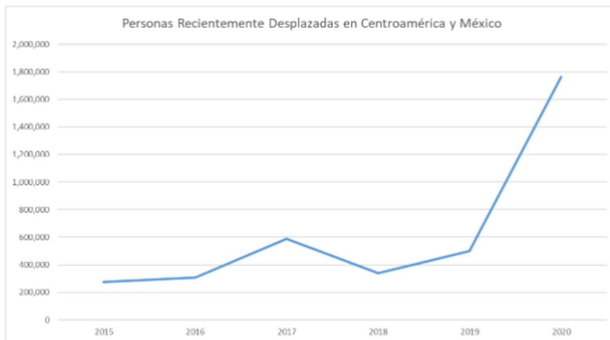
Figura 2: Nuevos desplazados en Centroamérica y México