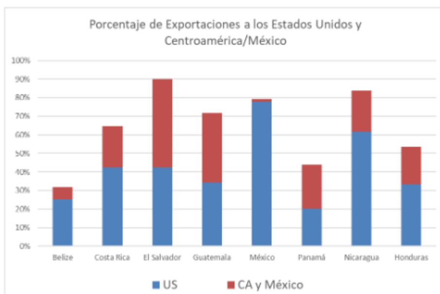
Gráfico 1: Porcentaje de exportaciones a EE.UU. e intrarregionales

A pesar del crecimiento positivo de las exportaciones en la última década, Centroamérica y México están rezagados con respecto a otros mercados comparables en el mundo. Desde 2010, el volumen de las exportaciones de la región ha tenido un crecimiento medio del 2,3 % anual. La misma cifra para todos los mercados emergentes y las economías en desarrollo es casi el doble, con un 4,2 por ciento 17 . Los cuellos de botella en el transporte y la logística, las medidas aduaneras unilaterales y los procedimientos transfronterizos a menudo constituyen una gran carga para el comercio intrarregional de bienes. Además, las economías centroamericanas están por debajo de otros países de América Latina y el Caribe en términos de valor agregado a las exportaciones 18 , lo que significa que las exportaciones tienen un valor agregado relativamente bajo en comparación con los vecinos de América Latina y del Caribe. Persisten tendencias similares en la inversión. Desde 2010, la inversión anual como porcentaje del PIB ha sido, en promedio, del 23% en Centroamérica y México, en comparación con el 32% en los mercados emergentes y las economías en desarrollo 19 .