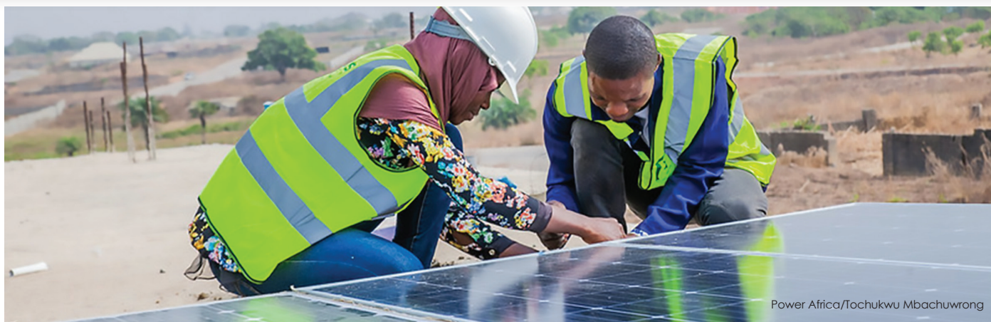
Power Africa/Tochukwu Mbachuwrong