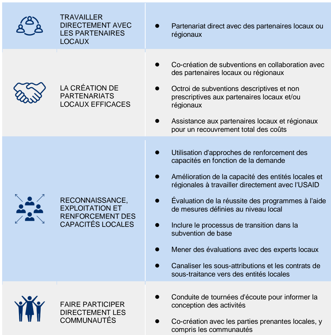
Figure 2 : Les 14 bonnes pratiques évaluées dans le cadre du projet pilote de l'USAID relatif à l'indicateur des programmes menés au niveau local

rehausser l'ambition de l'USAID en ce qui concerne la manière dont l'Agence encourage et évalue le leadership local dans ses programmes. Les enseignements tirés du projet pilote permettront également de corriger l'indicateur l'indicateur avant que l'USAID ne l'applique à l'ensemble de l'Agence en 2024.