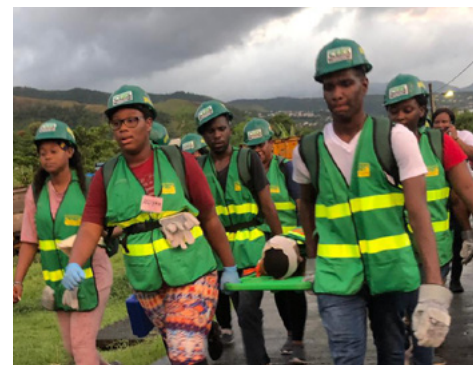
Kwa usaidizi wa USAID/BHA, vijana nchini Dominika wajitayarisha kuongoza shughuli za kukabiliana na maafa katika jumuiya zao kama sehemu ya Kamati za Hatua za Dharura za Vijana (YEAC), ikijumuisha kwa kushiriki katika mazoezi ya kuiga shughuli za kukabiliana na dharura.

Urejeshaji wa Hali ya Kawaida Haraka, DRR, na baadhi ya mipango ya ustahimilivu hutoa fursa zaidi za kuongeza ushirikiano uliopo na mpya na wenyeji. Kwa shinikizo ndogo la kuchukua hatua ya moja kwa moja kwa moja kwenye eneo husika, shirika la USAID na washirika wa ene husika wana fursa ya kushiriki majadiliano ya makusudi kuhusu kujenga ushirikiano wa kimkakati, wa muda mrefu, pamoja na kupitisha utengenezaji wa pamoja na “Miundo Bora na Utekelezaji”. 10 Maarifa ya hatari ya eneo husika na mahusiano mbalimbali ya jumuiya ni muhimu sana katika kubuni, kuongoza, na kutekeleza masuluhisho. Isitoshe, DRR yenye ufanisi na ubunifu na mipango ya ustahimilivu hunufaika kutokana na uwekezaji wa miaka mingi ambao unategemea uwepo endelevu na kujitolea kwa muda mrefu ambako washirika wa eneo wanaweza kutoa. Uwekezaji huu wa ER4 unaweza kuwezesha washirika wa eneo husika kuongoza na kuchukua hatua yenye ubora wa juu bila usaidizi wa kimataifa kuhitajik.